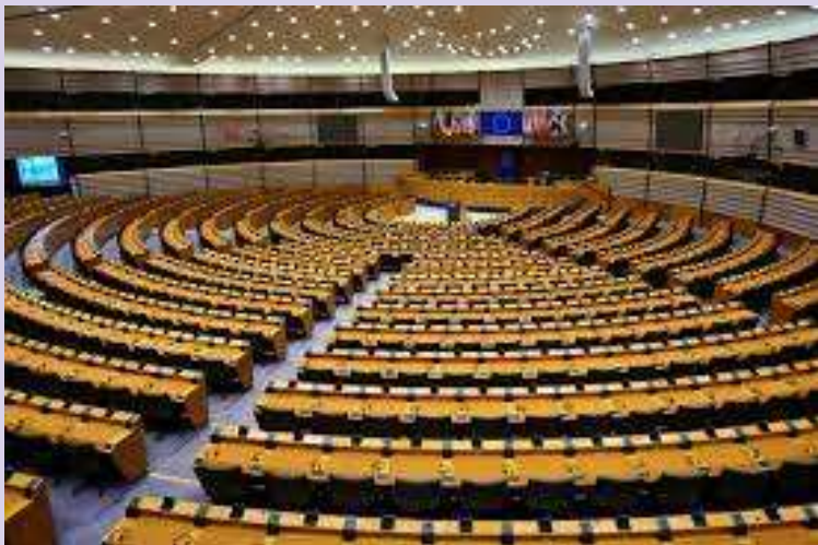
PARLAMENTO POR DENTRO