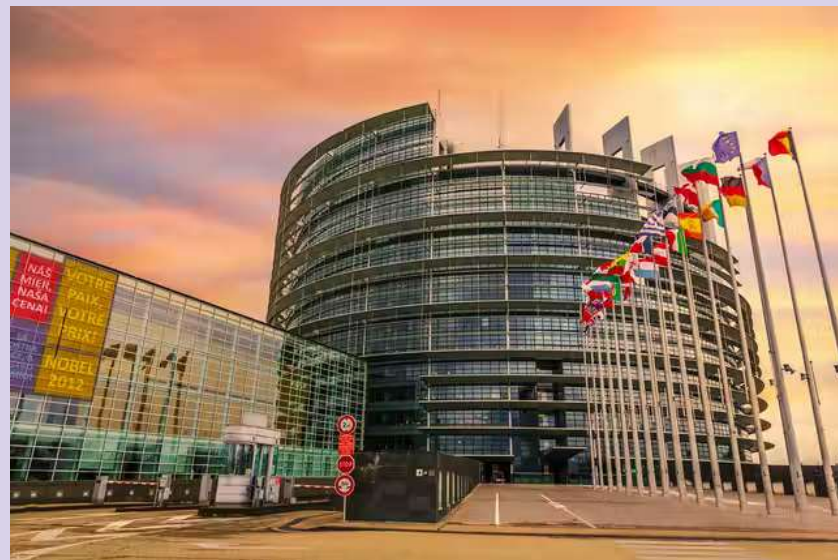
PARLAMENTO POR FUERA